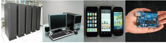
(a) Klaster (b) Komputer osobisty (c) Urządzenia mobilne (d) Mikrokontroler