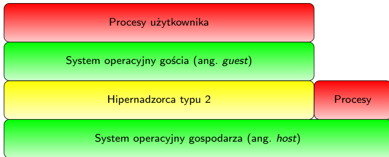
Rysunek: Wirtualizacja z użyciem hipernadzorki typu 2